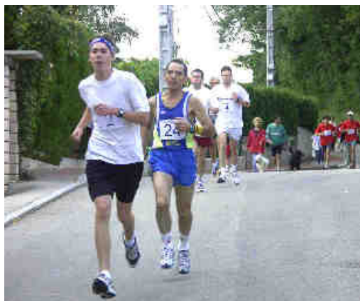
PHOTOS PRISES LORS DE LA VILLAGEOISE 2004