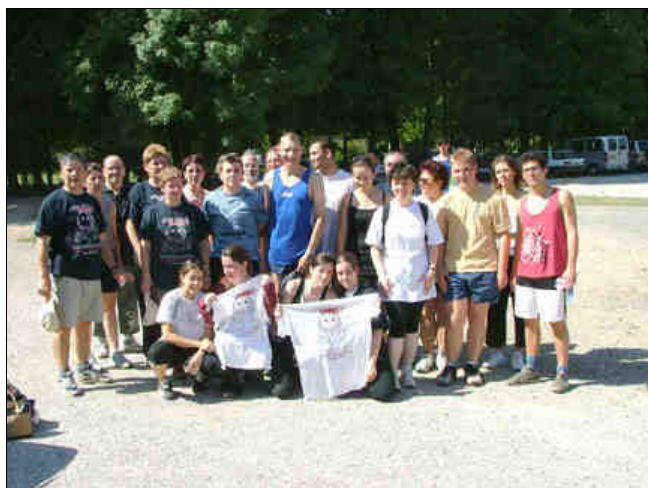
L'équipe « GUILLAUME ESPOIR » 2005

Courir le matin dans la campagne .... Marcher et découvrir, sur les hauteurs verdoyantes, un village magnifique !... L'ambiance sera naturellement à la bonne humeur !!! ... et le soleil de la partie !!!