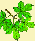
Solutions GEInfos n°71

N'oublions pas non plus, durant le déjeuner, le tirage de la « super » Tombola, avec de nombreux lots à la clé.